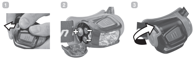
Figure 2 – Battery Replacement Remplacement des piles Einlegen der Batterien

sees this press as a signal to turn the light off and switch to the other light source simultaneously.