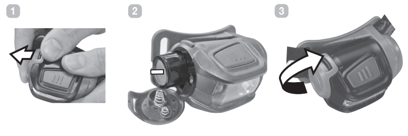
Figure 2 – Battery Replacement / Remplacement des piles / Einlegen der Batterien

and hold the button down to switch light sources, you will be in darkness for about one second as the light sees this press as a signal to turn the light off and switch to the other light source simultaneously.