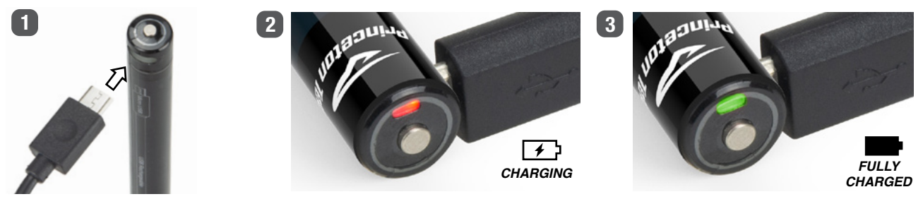
Figure 2 – Charging

Runtime is defined as the duration of time from the initial light output value—defined as 30 seconds after the point the device is first turned on—using fresh batteries, until the light output reaches 10% of the initial value.