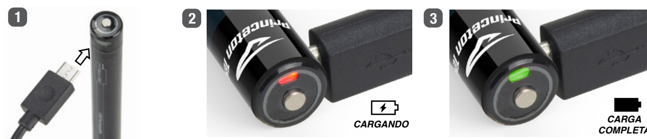
Figura 2 – Carga

El tiempo de funcionamiento se define como el intervalo de tiempo entre el nivel lumínico inicial —definido como los 30 segundos siguientes al momento en que el dispositivo se enciende por primera vez— usando baterías nuevas, hasta que el nivel lumínico alcanza el 10% del valor inicial.