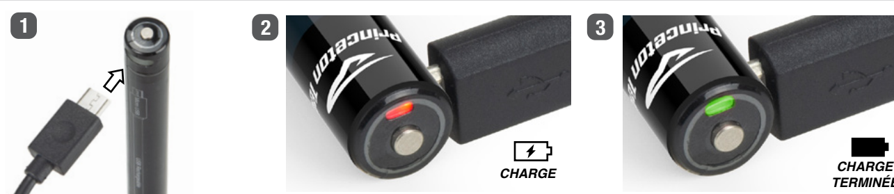
Schéma 2 – Charge en cours

Remarque : si la lampe est éteinte pendant plus d'une minute, elle repassera sur le mode par défaut qui est le mode intensité INTERMÉDIAIRE lorsqu'elle sera rallumée.