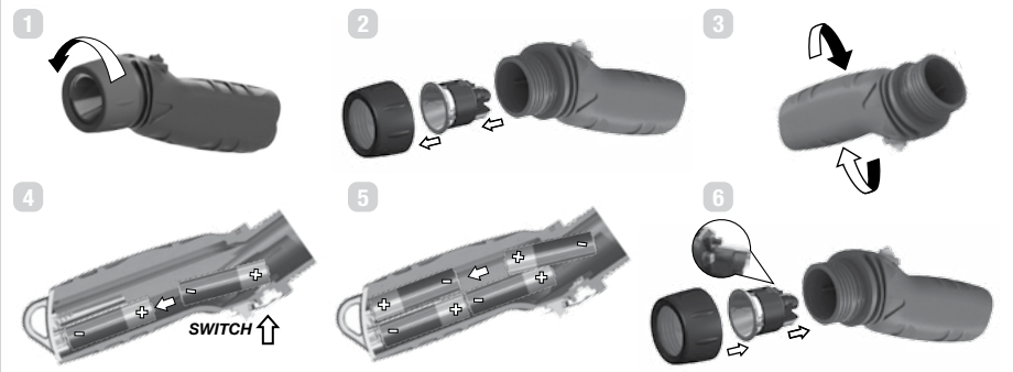
Figure 2 – Battery Replacement Remplacement des piles Betriebsartenschalter